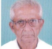
श्री.धनपाल आ.मगदूम मुख्य कार्यालय,आष्टा.